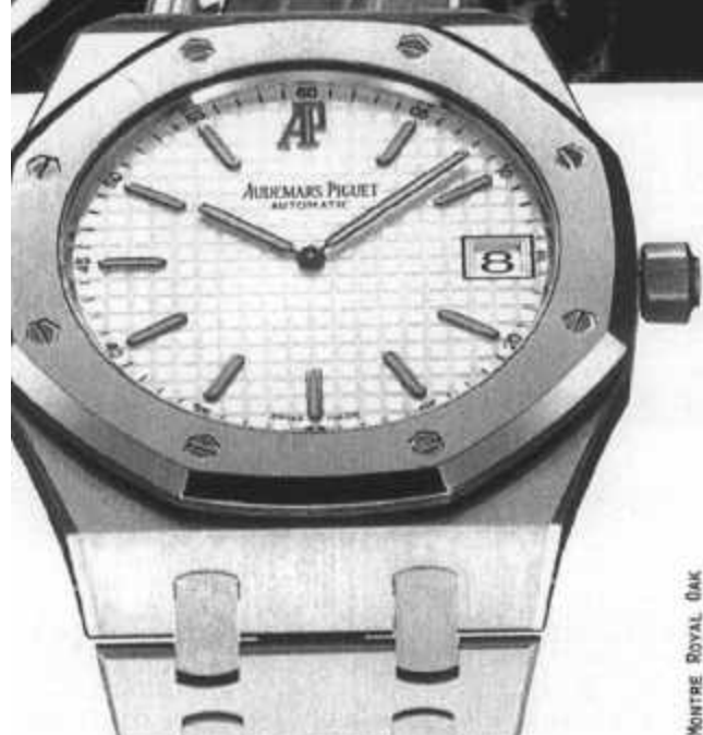
MONTRÉ ROYAL OAK

POUR CÉLÉBRER LES TRENTE ANS DE LA ROYAL OAK, AUDEMARS PIGUET S'ASSOCIE À ALINGHI, LE DÉFI SUISSE POUR LA COUPE DE L'AMERICA 2003.